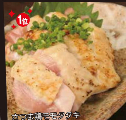
1位 さつま鶏モモタタキ