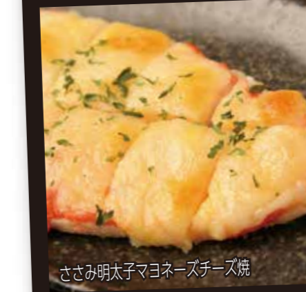
ささみ明太子マヨネーズチーズ焼